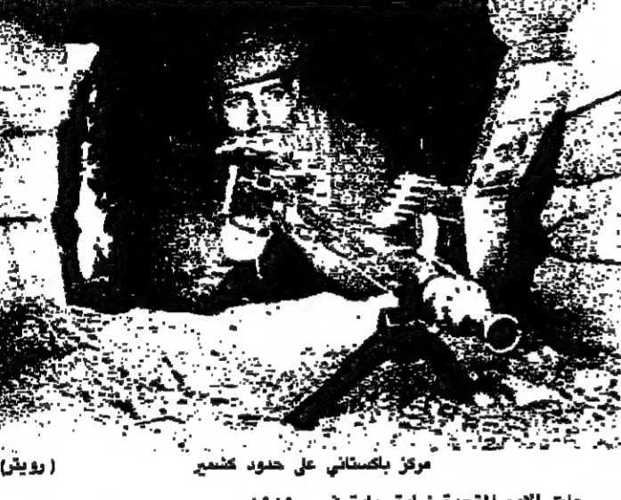
مركز باكستاني على حدود كشمير

سجلت الامم المتحدة زيادة حادة في عدد الانتهاكات الحدودية بين الهند وباكستان، اللتين نشب بينهما نزاع بسبب منطقتي كشمير. وذلك في الربع الاول من عام ١٩٩٠. وقال البريفيدير جنرال جيروبي ان انتهاكات الهند في كشمير في الربع الاول من العام من ١٩٩٠ كانت ١٣ شخصاً في عام ١٩٨٩ و ١٠٠ في عام ١٩٨٨. وقال البريفيدير ان سبعة اشخاص قتلوا على الجانب الباكستاني في الربع الاول من العام من ١٩٩٠ و ١٣ شخصاً في عام ١٩٨٩. وقال البريفيدير ان سبعة اشخاص قتلوا على الجانب الباكستاني في الربع الاول من العام من ١٩٩٠ و ١٣ شخصاً في عام ١٩٨٩. وقال البريفيدير ان سبعة اشخاص قتلوا على الجانب الباكستاني في الربع الاول من العام من ١٩٩٠ و ١٣ شخصاً في عام ١٩٨٩.